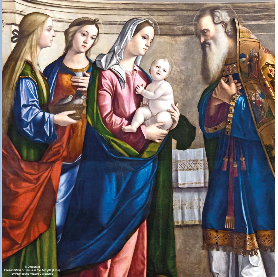
© Diocesan Presentation of Jesus in the Temple (1610) by Francesco Vittore Carpaccio

PRESENTATION PRESENTACIÓN of the LORD del SEÑOR